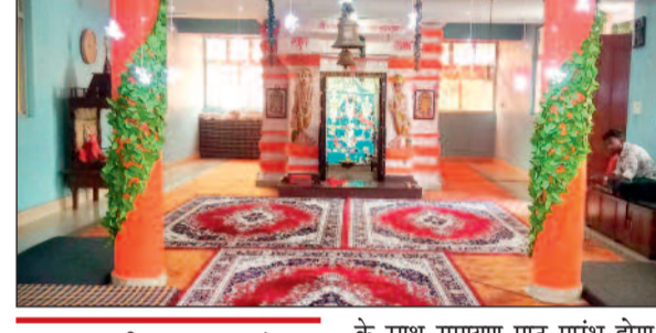
हरिभूमि न्यूज >>>धमतरी

महाआरती, रामायण पाठ के साथ भव्य शोभायात्रा निकलेगी