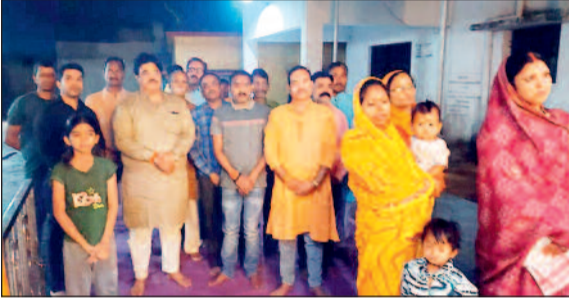
हरिभूमि न्यूज >>>धमतरी