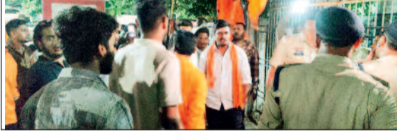
हरिभूमि न्यूज >>>धमतरी

हनुमान जी की मूर्ति के साथ हुई तोड़फोड़ के मामले को लेकर हिन्दू जागरण मंच ने सिटी कोतवाली का घेराव कर आरोपी की गिरफ्तारी की मांग की। उल्लेखनीय है कि मंगलवार को पुराने कृषि उपज मंडी परिसर में स्थित हनुमान मूर्ति के साथ किसी अज्ञात व्यक्ति ने तोड़फोड़ की है। घटना की जानकारी होने पर आक्रोशित हिन्दू जागरण मंच व हिन्दू समाज के लोग सिटी कोतवाली में आरोपी को जल्द गिरफ्तारी की मांग